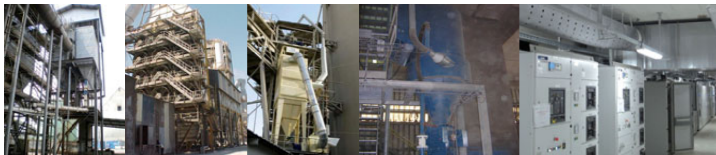
Dépoussiérage en sortie de sécheur. Dust control on the dryer. Remplacement filtres à graviers par filtres à manche. Replacement of gravel filters by bag filters. Dépoussiérage de silo. Dust control on silo. Aspiration Centralisée Haute Dépression dans zone d'emballage. High Vacuum Centralised Dust Cleaning in Packaging area. Ventilation refroidie et mise en surpression des locaux électriques. Positive pressure ventilation using cooled and filtered air in an electrical room.