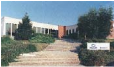
Direction Générale - Services Généraux - Export - Agence