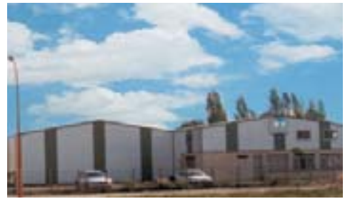
Ateliers de Saint-Mariens