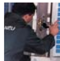
MISE EN ROUTE