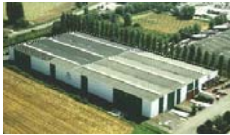
Production - Logistique - Bureau d'Etude